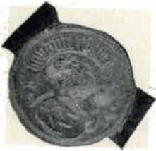
E. Boudyn Hart Boudynsz. 1448.