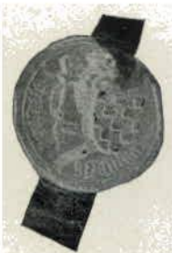
K. Pouwel Pouwelsz. [van Santen] 1448.