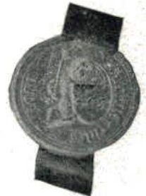
I. Vranc Claeszoen [van den Berch] 1482.