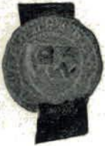
A. Florens Zelants soen 1368.